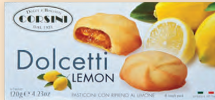
Долчети с лимон 120 г