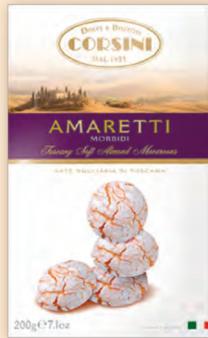
Амарети 200 г