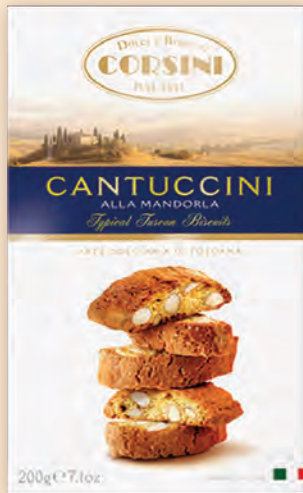
Кангучини 200 г