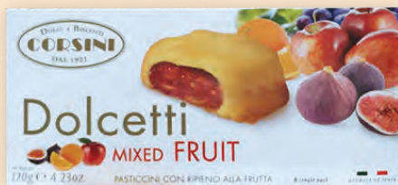
Долчети с плодове 120 г