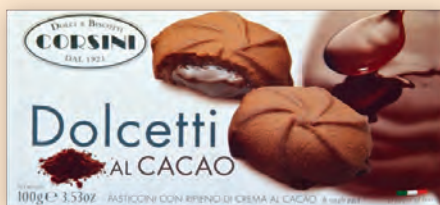
Долчети с какао 100 г