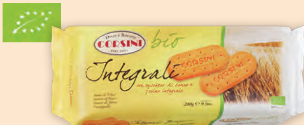
Интегрални 280 г

Историята на Corsini започва от едно италианско семейство, което от векове произвежда своите продукти, в сърцето на Тоскана. Така от 1921 г. Corsini произвежда сладкиши и бисквити, следвайки своите семейни рецепти. Corsini използва жива квас за направата на вкусните специалитети. Производствените процеси се характеризират с контрол на качеството, още от избора на суровините.