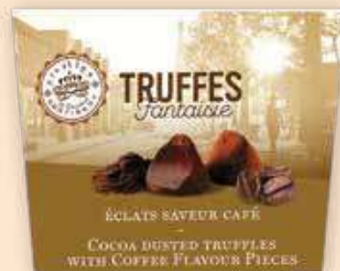
328459 Трюфел Балотин, Кафе 160 г