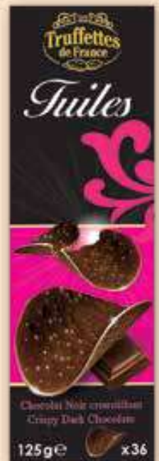
327002 Шоколадов чипс Дарк 125 г