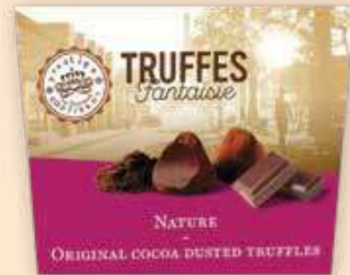
328509 Трюфел Балотин, Какао 160 г

През 1895 г. френският сладкар Луи Дюфур имал идея да създаде вкусен завършек на годината - бонбон от ганаж със сферична форма, потопен в разтопен шоколад и поръсен деликатно с какаова пудра. Така се родил шоколадовият трюфел. Днес намираме този бонбон с френско потекло, олицетворен в марката „Truffettes de France“.