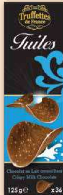
327001 Шоколадов чипс Млечен 125 г