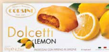
224379 Долчети с лимон 120 г