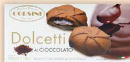
224362 Долчети с какао 100 г