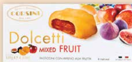
224355 Долчети с плодове 120 г