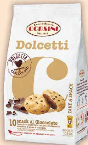
227069 Корсини Долчети с шоколад 300 г