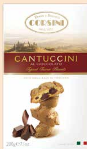
224716 Корсини Канточини с шоколад 200 г