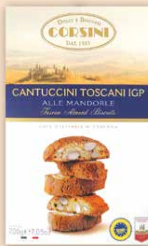
226441 Кантучини 200 г