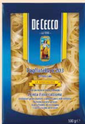
500203 Талиатели (203) 500 г

✓ Размесване само със студена вода – до 15 градуса