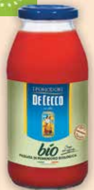
530520 сос Пасата 520 г