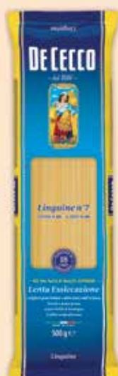
500007 Лингуини (7) 500 г