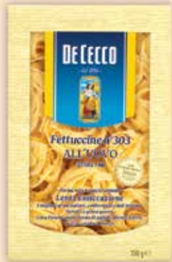
513303 Фетучини с яйца 250 г