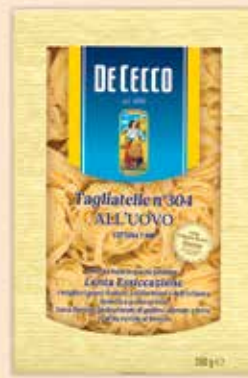
513304 / 510304 Талиатели с яйца 250 г, 500 г