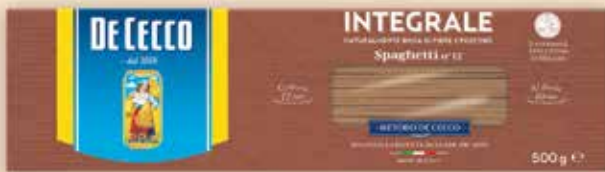
520012 Спагети 500 г