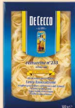
500233 Фетучини (233) 500 г