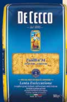
500034 Фусили (34) 500 г