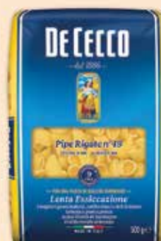
500049 Пайп ригате (49) 500 г