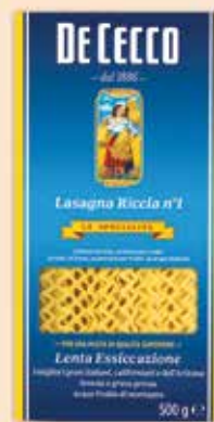
502001 Лазаня (1) 500 г