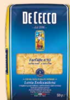
501093 Фарфале (93) 500 г