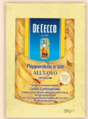
512101 Папарделе с яйца 250 г