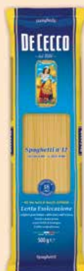
500012 Спагети (12) 500 г