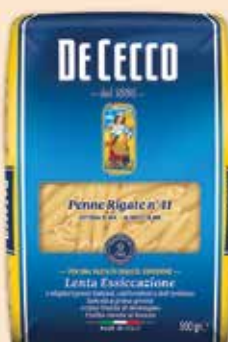
500041 Пенне ригате (41) 500 г