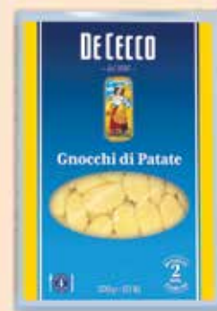
520201 Ньоки 500 г