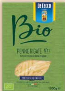
561041 Пенне ригате 500 г