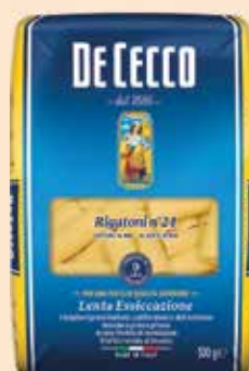
500024 Ригатони (24) 500 г