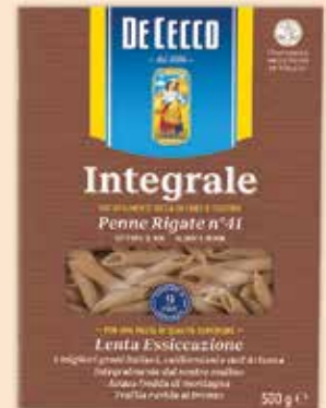
501041 Пенне ригате 500 г