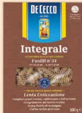
521034 Фусили 500 г