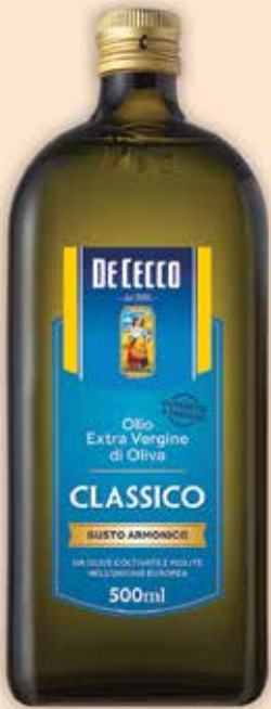
542002/ 544001/ 541001 Маслиново масло Екстра Върджин 500 мл, 750 мл, 1 л