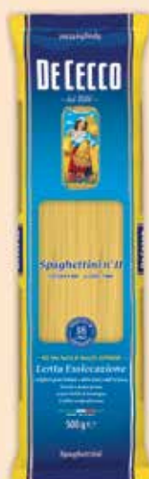
500011 Спагетини (11) 500 г